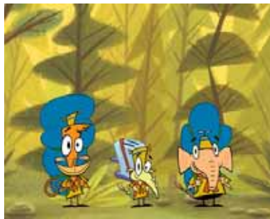
「キャンプ・ラズロ ラズロはどこ?」