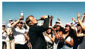
© 2020 Zentropa Entertainments3 ApS, Zentropa Sweden AB, Topkapi Films B.V. & Zentropa Netherlands B.V.

アカデミー国際長編映画賞に輝いたデンマーク映画。『偽りなき者』のトマス・ヴィンターベア監督とマッツ・ミケルセンが再び組み、お酒で生きる自信や喜びを取り戻そうとする中年男をシニカルかつコミカルに描く。