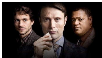
© 2013 Chiswick Productions LLC. All rights reserved.

トマス・ハリスの世界的ベストセラー小説を原作とする映画「レッド・ドラゴン」の登場人物を引継ぎ、舞台を2013年に移したオリジナル・ストーリーである本作。映画版「ハンニバル」シリーズに登場するFBI行動科学課のジャック・クロフォードや精神科医のチルトン医師、メイスン・ヴァージャーやフランシス・ダラハイドも登場する。美食家であるレクター博士による、まるで芸術品のように並ぶ人肉料理や、マッツ・ミケルセンの美しい所作が恐ろしくも魅力的なドラマ。