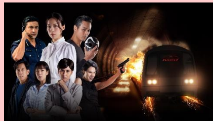
「サードレール 奪われた列車」 © Ochre Pictures Pte Ltd Private and Confidential

ハイジャックされた列車が舞台のシンガポールの最新クライム・スリラー。武装したテロリスト集団と人質となった乗客たちによる緊迫感あふれる人間ドラマと、警察や交渉人などの危機管理チームによるスリリングな駆け引きが繰り上げられる。