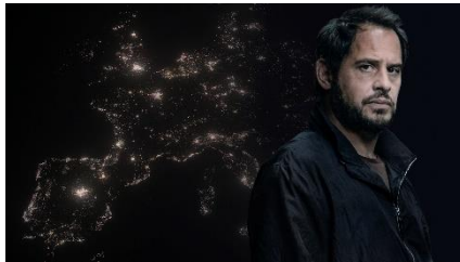
「BLACKOUT—ヨーロッパ大停電—」