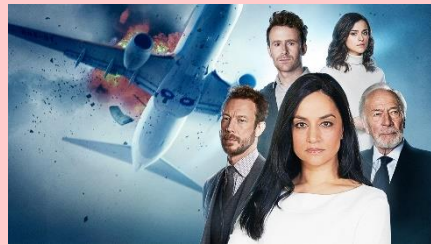
「DEP：重大事故捜査班～航空機編」 © 2019 Shaftesbury Departure Inc. & Greenpoint Productions Departure Limited.

交通機関で起きた大規模な事故を調査するチームが、重大事故に隠された陰謀と真相を追う、カナダの大ヒット・パニックドラマ。航空機、高速列車、旅客船と、シーズンごとに事故の舞台を変え、各シーズン全6話を通して、1つの事故を調査していく。