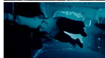
「DEP：重大事故捜査班～航空機編」