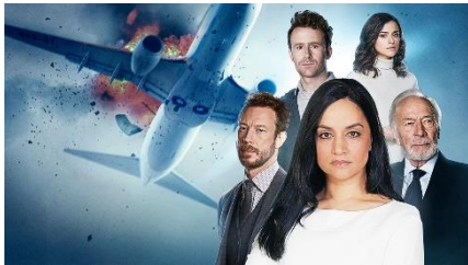
「DEP：重大事故捜査班～航空機編」 © 2019 Shaftesbury Departure Inc. &Greenpoint Productions Departure Limited.

日本唯一の*1アクション海外ドラマ専門チャンネル「アクションチャンネル」（A X N株式会社、本社：東京都渋谷区、代表取締役社長大園天樹）は、『パニック・アクション特集』と題して、交通機関で起きた大規模な事故を調査するチームが、重大事故に隠された陰謀と真相を追うカナダの大ヒットドラマ「DEP：重大事故捜査班」、サイバー攻撃によって起こされた大規模な停電に襲われたヨーロッパでパニックに陥る世界を描き、ドイツのテレビ賞を多数受賞した「BLACKOUT—ヨーロッパ大停電—」、そしてハイジャックされたシンガポールの列車で緊迫の人間ドラマが繰り広げられる「サードレール 奪われた列車」の3作品を独占日本初放送*2します。