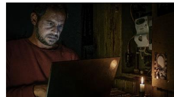
「BLACKOUT—ヨーロッパ大停電—」