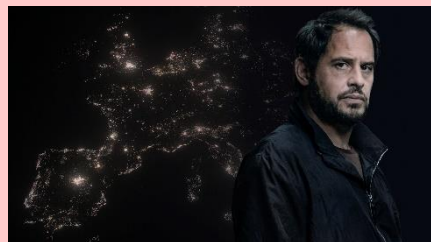
「BLACKOUT—ヨーロッパ大停電—」

街からガソリンがなくなり、食料が消え、電話も通じない…サイバー攻撃によって起こされた大規模な停電に襲われたヨーロッパが、混乱の渦に飲み込まれる中、指名手配犯となった主人公の逃亡劇を描く、ドイツのパニック・アクション！