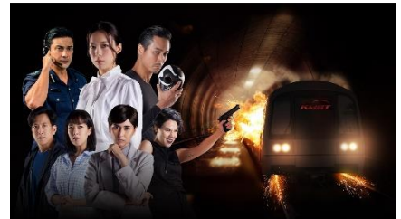
「サードレール 奪われた列車」 © Ochre Pictures Pte Ltd Private and Confidential